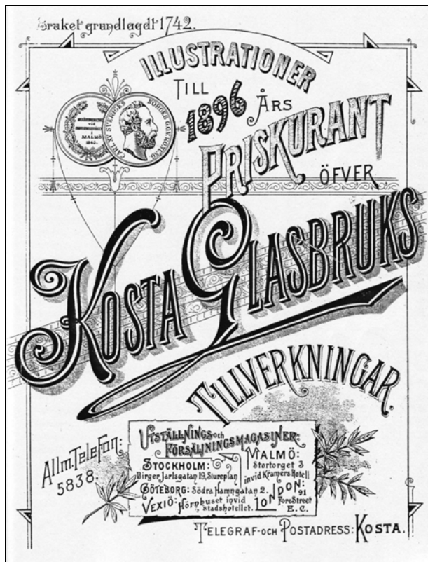
Abb. 2008-1-03/001 MB Kosta 1896, Einband / Titelblatt Sammlung Johansson

Ges. gesch. Warenzeichen: nicht vorhanden