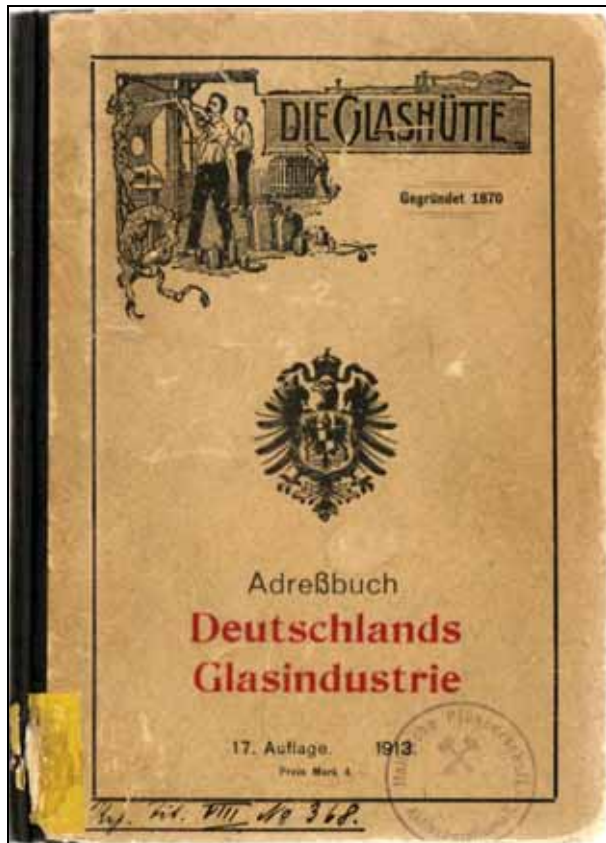
Abb. 2007-3-06/001 Glashütte Adressbuch 1913, Einband

Auf der Seite vor dem Inhaltsverzeichnis befindet sich ein Stempel: „Institut für Wirtschaftsgeschichte (DAW) Berlin - Bibliothek“