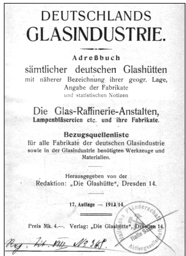
Abb. 2007-3-06/002 Glashütte Adressbuch 1913, Einband

handschriftlich: „Reg. Tit. VIII No 368“