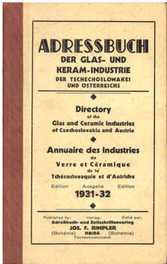
Abb. 2005-1-11/001 Adressbuch der Glas- und Keram-Industrie 1931-1932 der Tschechoslowakei und Österreichs, Einband