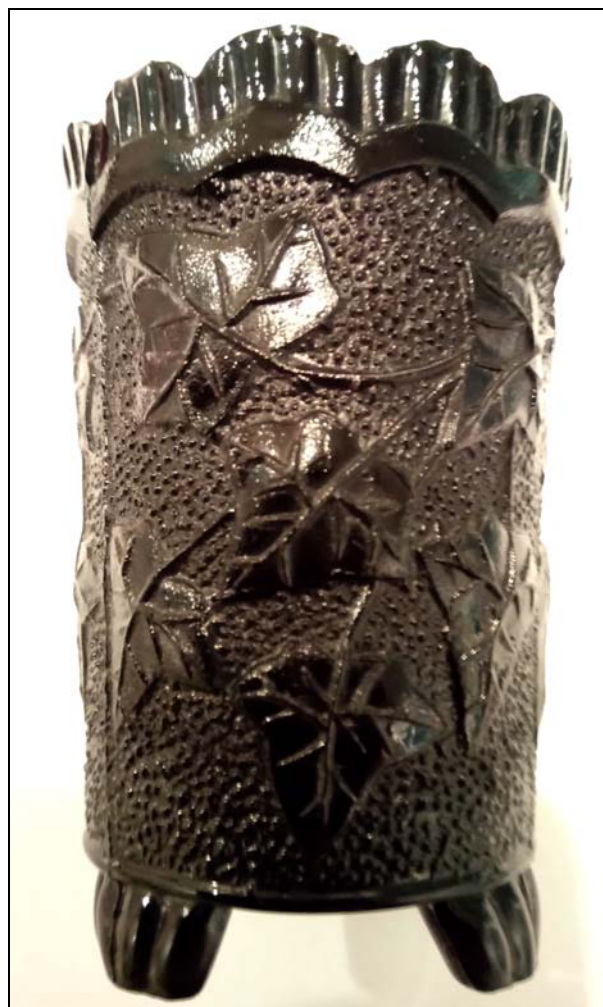
Abb. 2017-2/64-06 Black Milk Glass Ivy Patterned Spill Vase, Greener?, c. 1880'S