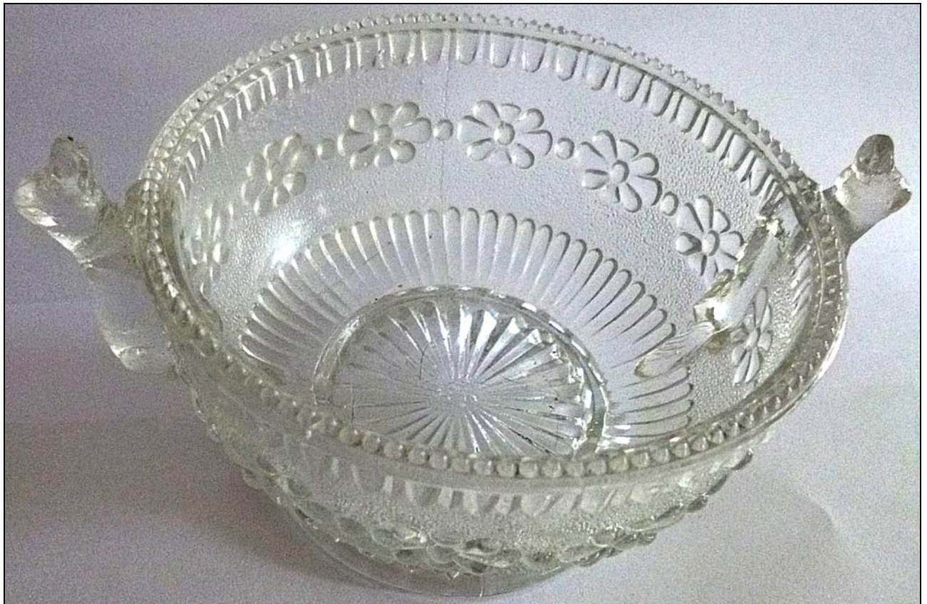
Abb. 2017-2/64-01 Schale mit Hunden als Griffen, Blüten, unregelmäßig gekörnt, farbloses Pressglas, H 6,5 cm, D 10 cm Sammlung Groß Unterseite Boden mit eingepresster Löwen-Marke, s. Henry Greener, Sunderland