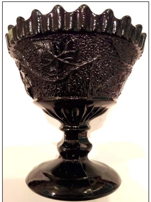
Abb. 2017-2/64-03 /-04/-05 (nächste Seite) Sahnekännchen mit Efeu-Muster, Zigarrenvasen (?) ..., unregelmäßig gekörnt, opak-schwarzes Pressglas, H ??? cm, D ??? cm Sammlung Groß keine Marke Henry Greener, Sunderland