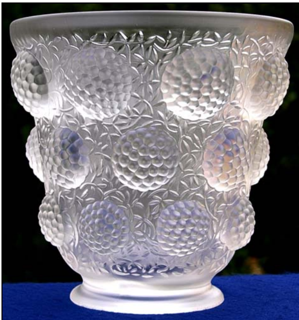
Abb. 2017-1/27-03 Vase „ LES CABOCHONS “, mit Himbeeren farbloses Pressglas, mattiert, H 14 cm, D 16,7 cm Sammlung Stopfer Musterbuch Verlys 1934, Planche 3, No. 1157

Die farblose Vase „ LES CABOCHONS “ ist außen mattiert und ungemarkt. Die Wandung ist in 3 Reihen mit je 8 großen „Himbeeren“ geschmückt. Dazwischen