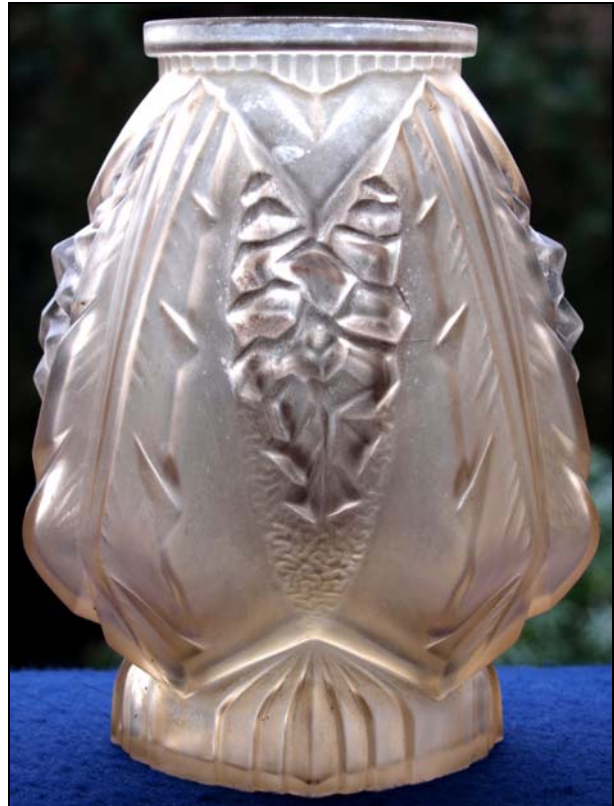
Abb. 2017-1/27-04 Vase mit Früchten zwischen Eckpfeilern bräunliches, form-geblasenes Glas, H 19,4 cm, D 8,5 cm Sammlung Stopfer außen im Boden gemarkt „ Muller frères, Lunéville “ s. Hilschencz-Mlynek, Ricke, Glas: Historismus, Jugendstil, Art Déco, Marke ab 3.3.1928

Die letzte Vase stammt von „ Muller frères, Lunéville “ und ist aus dünn-wandigem, bräunlichem Glas. Sie hat eine vier-teilige Form mit grau besprühten Früchten zwischen 4 Eckpfeilern. Die abgebildete Marke wurde nach Hilschencz-Mlynek, Ricke im Buch „ Glas: Historismus, Jugendstil, Art Déco “ ab 3.3.1928 verwendet. H 19,4 cm, D 8,5 cm.