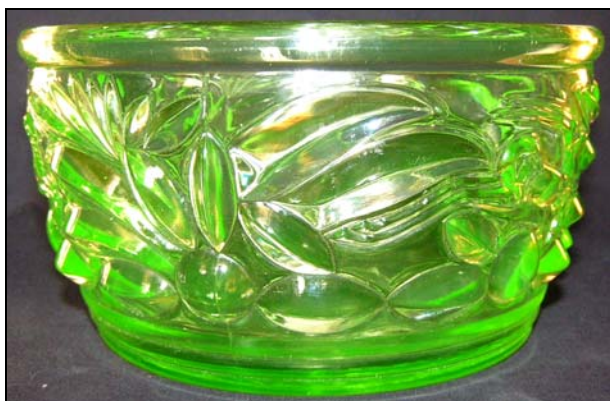
Abb. 2003-2-1/003 (Ausschnitt) MB VMG / Walther / Sächs. Glasfabrik / Bernsdorf 1931/1932 Tafel „Bernsdorfer Reliefglas“ Nr. 8007 und 8008, Schale „Gazellen“ MB Sammlung Mauerhoff

Abb. 2009-2/237 (Maßstab ca. 35 %) Schale „Gazellen“, uran-grünes Pressglas, H 11 cm, D 21 cm Sammlung Rühl & Sadler s. MB AG für Glasfabrikation vorm. Gebrüder Hoffmann, Bernsdorf O.L. 1931/1932, Tafel 66, Reliefglas, Entwürfe Richard Süßmuth, Penzig O.-L., Nr. 8008, 21 cm