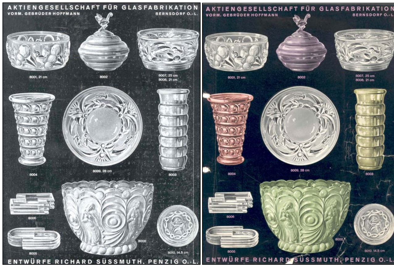
Abb. 2017-1/44-02 (Maßstab ca. 60 %)

Kuchenteller mit Gazellen, farbloses Pressglas, H ??? cm, D 28 cm