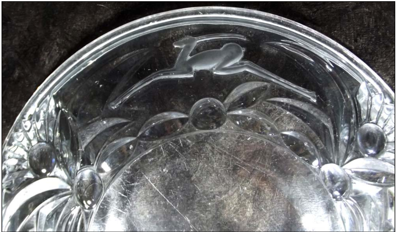
Abb. 2017-1/44-01 Kuchenteller mit Gazellen, farbloses Pressglas, H ??? cm, D 28 cm Sammlung Gerlach vgl. MB AG für Glasfabrikation vorm. Gebrüder Hoffmann, Bernsdorf O.L. 1931/1932, Tafel 66, Reliefglas, Entwürfe Richard Süßmuth, Penzig O.-L., Nr. 8008, 21 cm