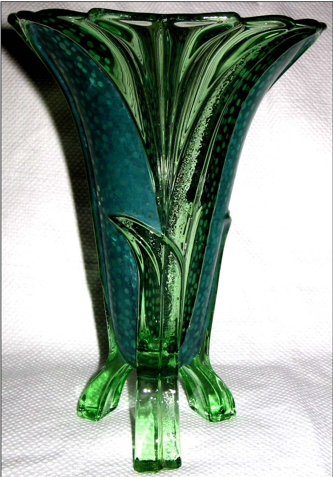
Abb. 2017-1/25-01 (Maßstab ca. 100 %)

Vase mit Blättern und 3 Füßen, grünes Pressglas, dunkelgrün beschichtet, Stil Art Déco, Vase H 21 cm, D ??? cm