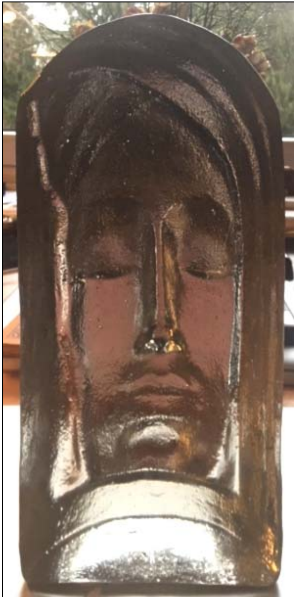
Abb. 2017-1/24-06 Maske einer Frau, farbloses Pressglas, satiniert 25,5 x 13,4 x 7,5 cm Boden mit eingepresster Marke Leerdam Sammlung Braeuer, Leerdam 1929