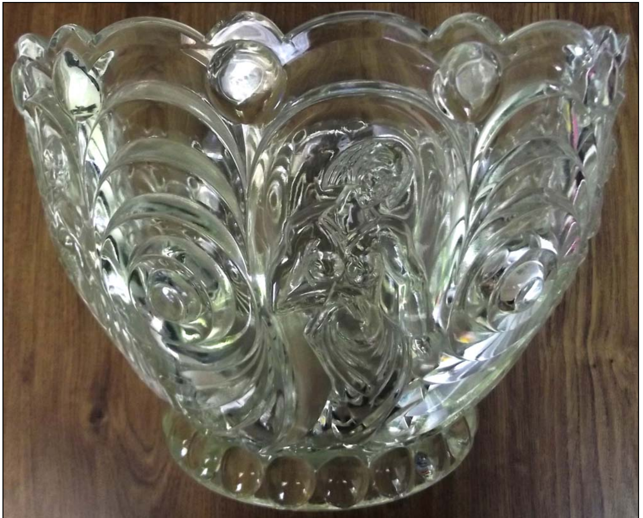
Abb. 2016-2/34-01 (Maßstab ca. 55 %)

Schale mit sechs Frauenbildern, farbloses Pressglas, H 20,5 cm, D Rand 29 cm, D Boden 17,5 cm Sammlung Gerlach