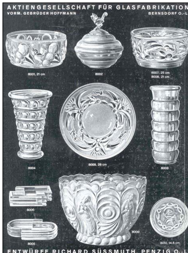
Abb. 2001-05/408 MB Bernsdorf 1932, Tafel 66, Reliefglas Entwürfe Richard Süssmuth, Penzig O.-L. azurblau, rosalin, bernstein, amethyst, edelgrün Sammlung Schmidt