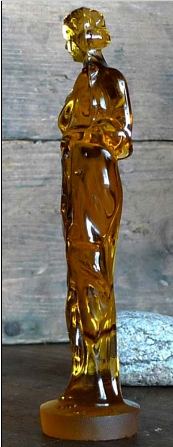
Abb. 2016-2/82-05 Dame mit Blumen, bernstein-farben., nicht mattiertes Pressglas H 16 cm, D Fuß 4 cm die Figur steht mit einem abgeschrägten Sockel zum Einstecken in einen ring-förmigen Sockel [Frog / Blumen- block] aus Pressglas mit Löchern zum Einstecken von Blumen Hersteller unbekannt, Tschechoslowakei, 1925-1938 Schale S. Reich / Českomoravské sklárny a.s. 1934 Sockel Bagley, England eBay UK, Art.Nr. 322330245881