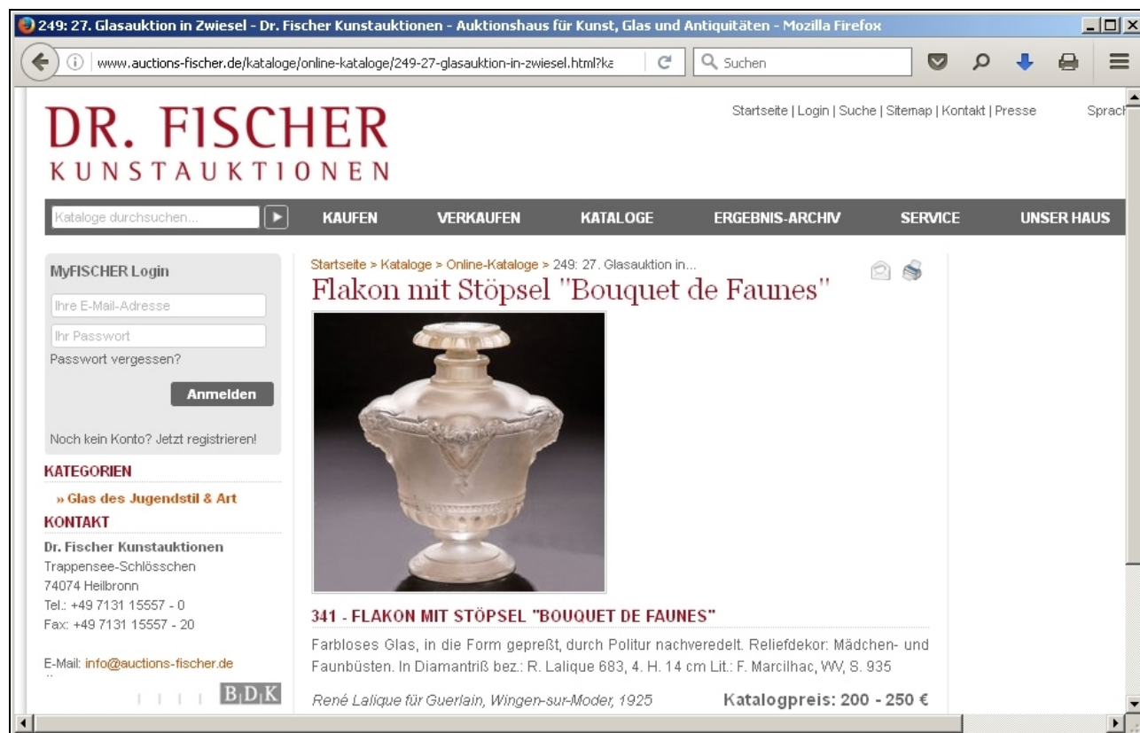
Abb. 2016-2/01-01 Los 341 - Flakon mit Stöpsel "Bouquet de Faunes", René Lalique für Guerlain, Wingen-sur-Moder 1925 http://www.auctions-fischer.de/kataloge/online-kataloge/249-27-glasauktion-in-zwiesel.html?kategorie=101&artikel=61642&L=&cHash=4791718bd9