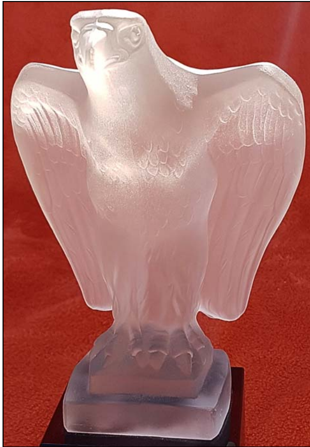
Abb. 2016-2/48-01 Adler aus farblosem Pressglas, satiniert H 16 cm, B 11 cm, mit Sockel H 21 cm Sockel opak-schwarzer Stein, H 5 cm, B 7,5 x 7,5 cm Sammlung Boschet Hersteller unbekannt, Deutschland, um 1900?

SG: Dieser Adler könnte sogar von Josef Riedel, Polaun , sein, wenn er einen opak-schwarzen Glassockel gehabt hätte ... aber in einem MB Riedel ist er nicht zu finden ... und weil in Österreich-Böhmen der Adler zwei Köpfe hatte, ist es eher ein Adler aus Deutschland , vielleicht aus Preußen . Das Saarland , wo er gefunden wurde, gehörte von 1815-1945 zu Preußen, zur so genannten Rheinprovinz ... siehe: