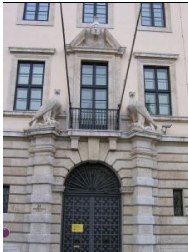
Abb. 2016-2/48-06 Haupteingang Bayerisches Ministerium für Wirtschaft München, Prinzregentenstraße www.denkmaeler-muenchen.de/ns/lgk.php ... Einzelbauten ...

SG: die beiden Adler wurden nach 1945 nicht entfernt ... die Fahnenstangen sind für Bayern und Deutschland