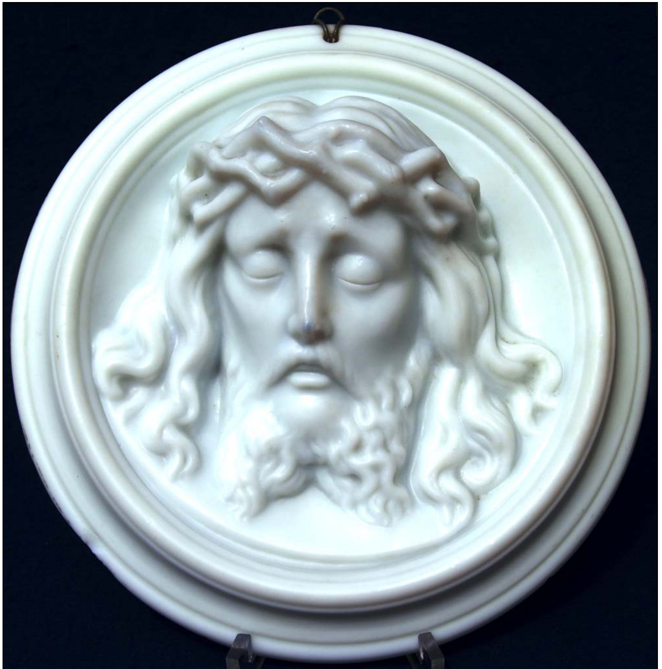
Abb. 2016-1/42-01 / Abb. 2016-1/42-02 (Maßstab ca. 70 %) Medaillon mit Christuskopf, opak-weißes und opalin-farbenes Pressglas, mattiert, H 6,8 cm, D 23,8 cm Sammlung Stopfer Hersteller unbekannt, Böhmen oder Mähren?, vor 1900