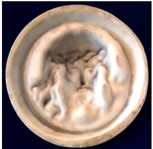
Abb. 2016-1/42-05 Relief-Bild Christuskopf opak-weißes Pressglas, mattiert, H 7 cm, D 23,5 cm Sammlung Kuban