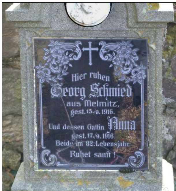
Bauerndorf Mirschikau / Mířkov, Heimatkreis Bischofteinitz Pfarrdorf Melnitz / Mělnice, Heimatkreis Bischofteinitz Garahsen / Garassen / Skařez, Heimatkreis Bischofteinitz Bischofteinitz, Horšovský Týn, Bezirk Taus / Okres Domařlice Region / Kray Pilsen Rausen / Rusín, Jägerndorf / Krnov, Region Mährisch-Schlesien / Moravskoslezský kraj, Kreis /Okres Freudenthal / Bruntál