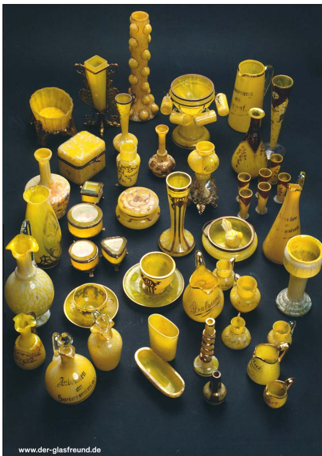
Abb. 2016-1/46-02; der glasfreund, 21. Jahrgang - Mai 2016, Nummer 59 Rücktitel: Bernsteinglas - Souvenirläser aus der Hochphase der Bäderkultur um 1900

www.pressglas-korrespondenz.de/aktuelles/pdf/pk-2013-4w-glasfreund-2013-49.pdf www.pressglas-korrespondenz.de/aktuelles/pdf/pk-2014-1w-glasfreund-2014-50.pdf www.pressglas-korrespondenz.de/aktuelles/pdf/pk-2014-2w-glasfreund-2014-51.pdf www.pressglas-korrespondenz.de/aktuelles/pdf/pk-2014-3w-glasfreund-2014-52.pdf www.pressglas-korrespondenz.de/aktuelles/pdf/pk-2014-4w-glasfreund-2014-53.pdf www.pressglas-korrespondenz.de/aktuelles/pdf/pk-2014-4w-ricke-lierke-geburtstag-2014 www.pressglas-korrespondenz.de/aktuelles/pdf/pk-2015-1w-glasfreund-2015-54.pdf www.pressglas-korrespondenz.de/aktuelles/pdf/pk-2015-1w-glasfreund-2015-55.pdf www.pressglas-korrespondenz.de/aktuelles/pdf/pk-2015-2w-glasfreund-2015-56.pdf www.pressglas-korrespondenz.de/aktuelles/pdf/pk-2015-3w-glasfreund-2015-57.pdf www.pressglas-korrespondenz.de/aktuelles/pdf/pk-2016-1w-glasfreund-2016-58.pdf www.pressglas-korrespondenz.de/aktuelles/pdf/pk-2016-1w-glasfreund-2016-59.pdf