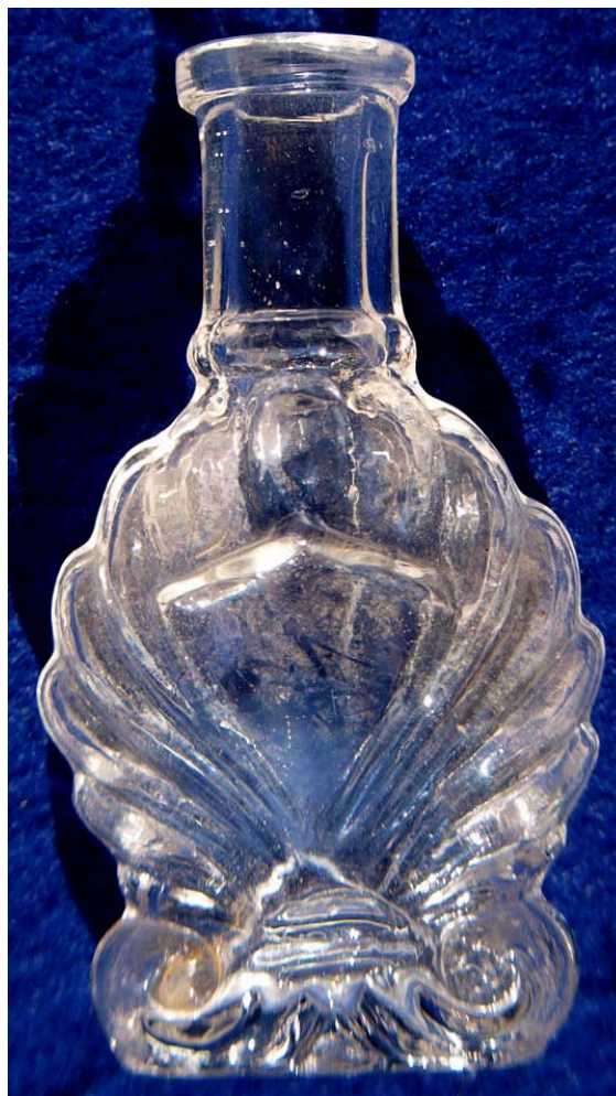
Abb. 2011-4/048 Flakon mit Muschel-Form farbloses Glas, H 7 cm, B 3,7 cm Sammlung Stopfer s. MB „Parfumerie-, Conserven-, Medicin-Gläser W. Limberg & Co., Glashütte Gifhorn“ von 1896, Blatt 41 Flacons und Pomadegläser, Nr. 2137 10 g aus Dröge / Gabriel, Gifhorner Glashütte, 2010, S. 225

Das letzte Objekt fällt ein wenig aus dem Rahmen. Es ist kleiner, rund und hat 3 Formnähte . Das Muster besteht aus Ranken & Blüten .