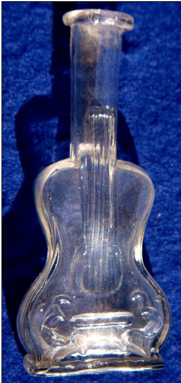
Abb. 2011-4/053 Flakon mit Gitarren-Form farbloses Glas, H 8,5 cm, B 3,5 cm Sammlung Stopfer Hersteller unbekannt, Österreich?, um 1900?