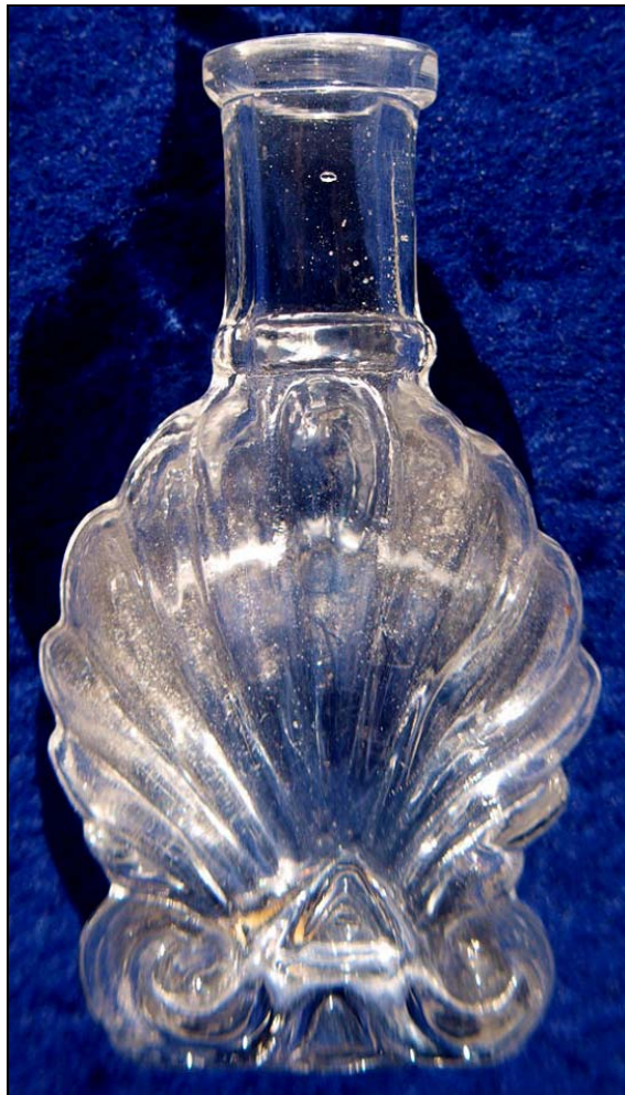
Abb. 2011-4/050 Flakon mit Wappen & Krone Herzogtum Salzburg farbloses Glas, H 8,8 cm, B 3,5 cm Sammlung Stopfer Hersteller unbekannt, Österreich?, um 1900?

Abb. 2011-4/049 Flakon mit Muschel-Form farbloses Glas, H 7 cm, B 3,7 cm Sammlung Stopfer s. MB „Parfumerie-, Conserven-, Medicin-Gläser W. Limberg & Co., Glashütte Gifhorn“ von 1896, Blatt 41 Flacons und Pomadegläser, Nr. 2137 10 g aus Dröge / Gabriel, Gifhorer Glashütte, 2010, S. 225