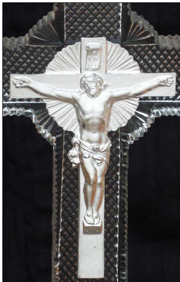
Abb. 2013-1/57-09 Postament mit Kreuz und reichem Schriff Fakturenbuch 1844-1845, S. 249 (SOA Zámrsk, HSNS, K 1154) aus Ausstellungskatalog „Von Neuwelt in die ganze Welt - 300 Jahre Harrach'sches Glas“, Prag / Pilsen 2013, S. 75