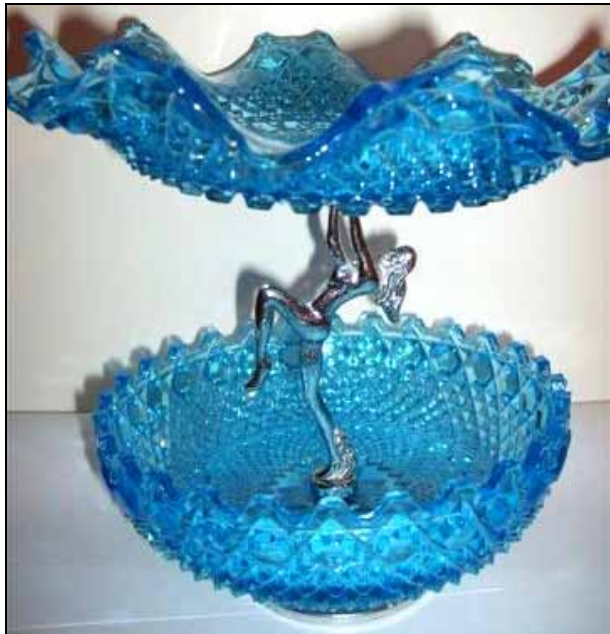
Abb. 2011-2/078 Schale mit Pseudo-Schliffmuster blaues Pressglas, H xxx cm, D xxx cm und H xxx cm, D xxx cm Sammlung Groß PK 2011-2, Carol Sumpter: Sowerby Glass Company in marigold (orange) iridescence in the 1920s - Service 2266 Indiana Glass Company USA in the 1970s