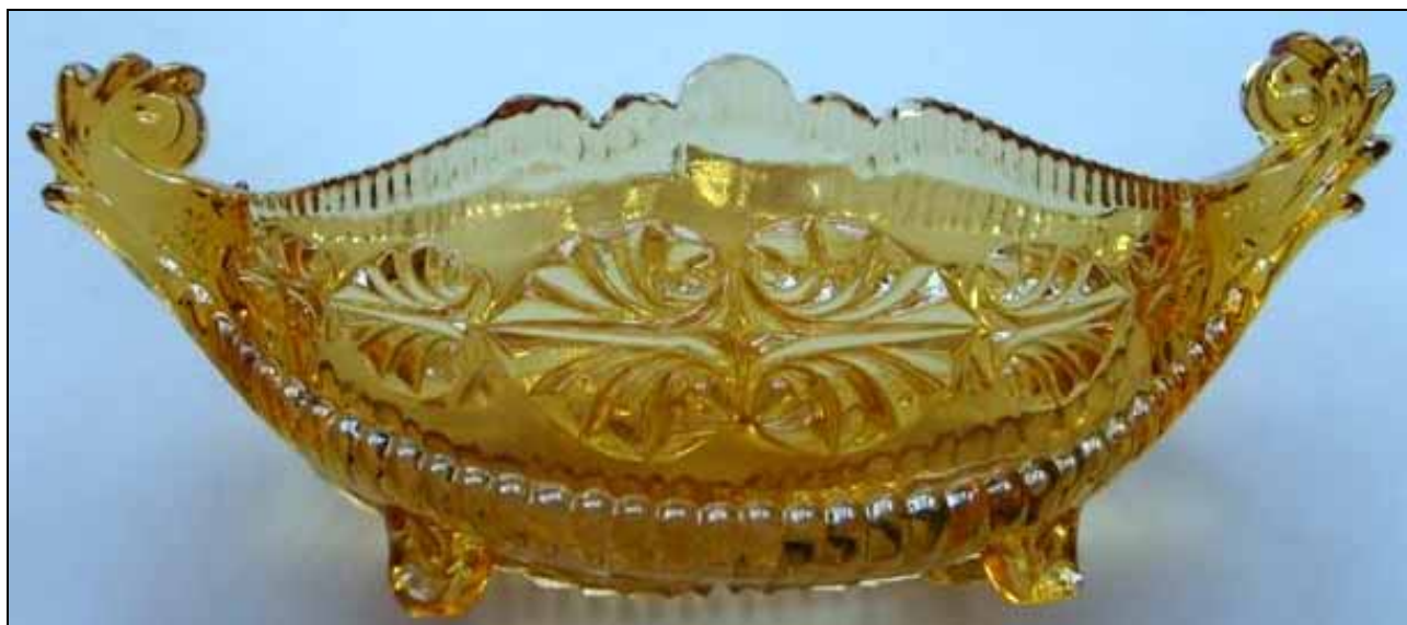
Abb. 2011-2/076 Schale mit 4 Füßen, bernstein-farb. Pressglas, H 7 cm, B 7 cm, L 22 cm, Sammlung Groß, Hersteller unbekannt, England, um 1930?