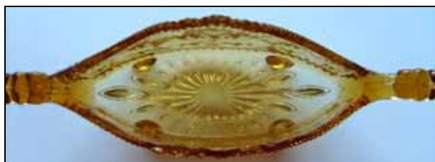
Abb. 2011-2/077 Schale mit 4 Füßen bernstein-farbenes Pressglas, H 7 cm, B 7 cm, L 22 cm Sammlung Groß, Hersteller unbekannt, England, um 1930?

Mit freundlichen Grüßen, Renate und Wolfgang Groß