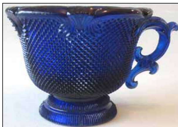
Abb. 2011-1/022 (Maßstab ca. 65 %) Tasse und Teller mit Sablée kobalt-blaues Pressglas, Tasse H 8,2 cm, D 10,7 cm Sammlung Vogt PV 1521 s. MB Launay, Hautin & Cie. um 1840, Planche 50, No. 1791 (S.L.) St. Louis