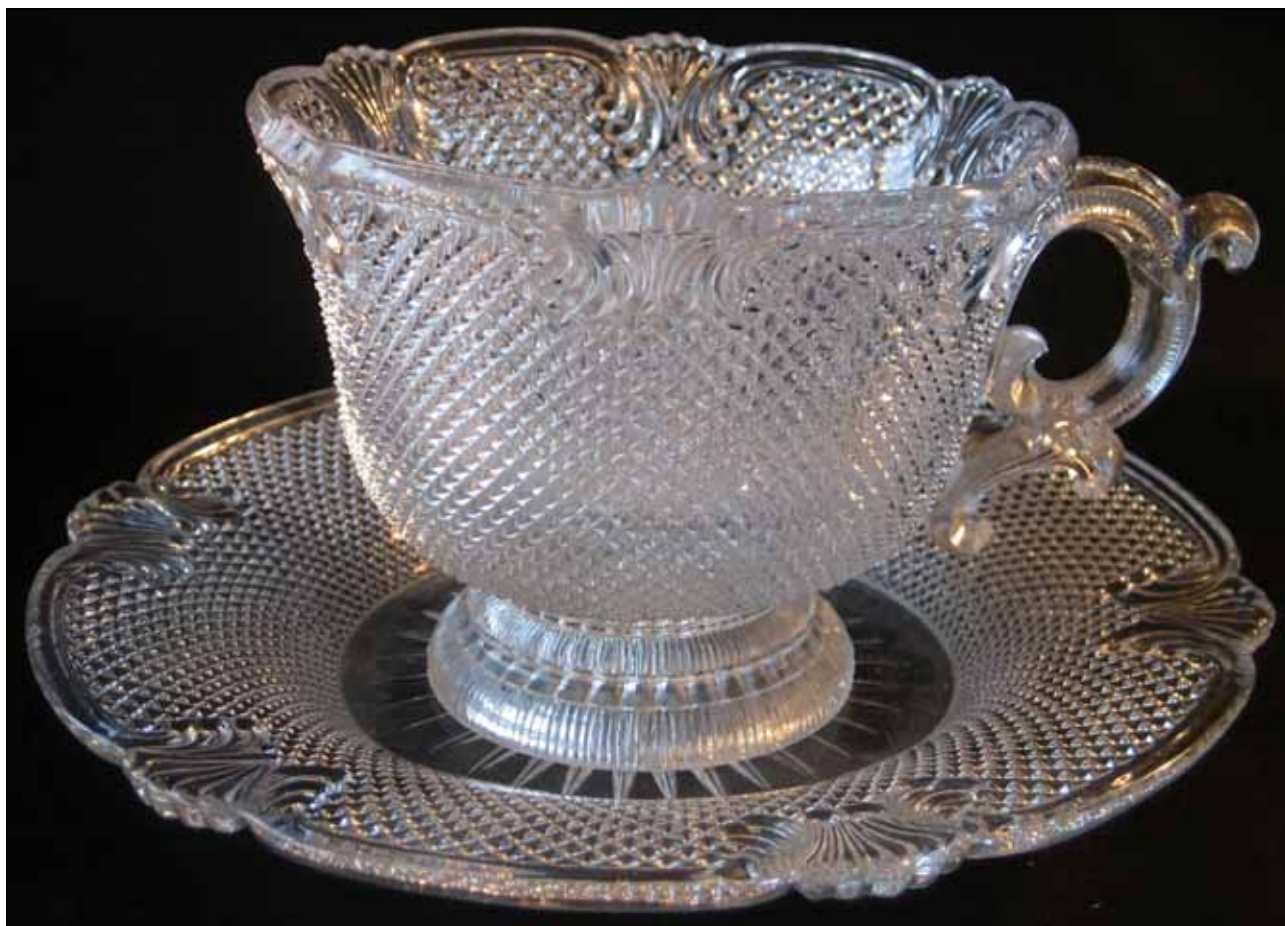
Abb. 2011-1/021 (Maßstab ca. 95 %) Tasse und Teller mit Sablée farbloses Pressglas, Tasse H 8,2 cm, D 10,7 cm, Teller H 2,5 cm, D 17 cm Sammlung Vogt PV 1521 s. MB Launay, Hautin & Cie. um 1840, Planche 50, No. 1791 (S.L.) St. Louis