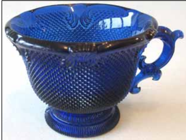
Abb. 2011-1/023 (Maßstab ca. 65 %) Tasse und Teller mit Sablée kobalt-blaues Pressglas, Tasse H 8,2 cm, D 10,7 cm Sammlung Vogt PV 1521 s. MB Launay, Hautin & Cie. um 1840, Planche 50, No. 1791 (S.L.) St. Louis