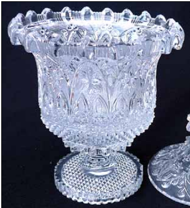
Abb. 2008-4/256 Zuckerdose mit neu-gotischem Dekor, Sablée farbloses Pressglas, H 20 cm, D 13 cm Sammlung Zeh s. MB Launay & Hautin, um 1840, Planche 18, Sucriers No. 1239, Baccarat, Sucrier fe. tulipe, m. sablée gothique