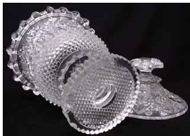
Abb. 2008-4/257 Zuckerdose mit neu-gotischem Dekor, Sablée farbloses Pressglas, H 20 cm, D 13 cm Sammlung Zeh s. MB Launay & Hautin, um 1840, Planche 18, Sucriers No. 1239, Baccarat, Sucrier fe. tulipe, m. sablée gothique