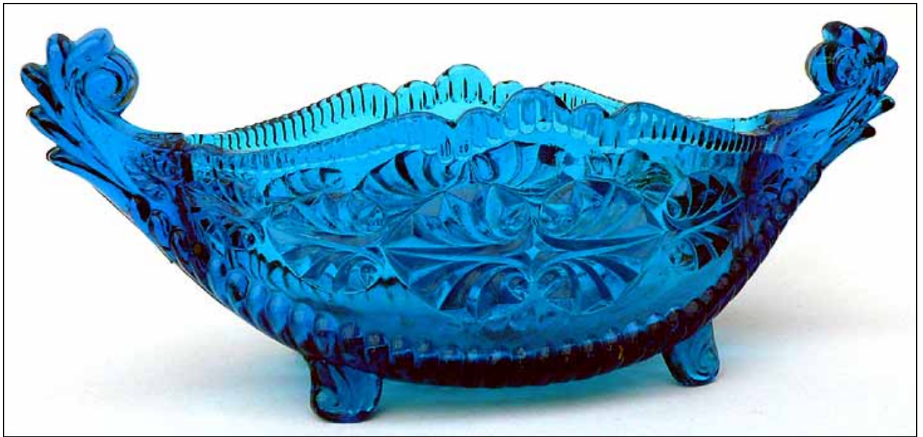
Abb. 2008-4/255 Jardiniere mit Pseudoschliff-Dekor, blaues Pressglas, H 9 cm, B 6,5 cm, L 22 cm Sammlung Zeh SG: Hersteller unbekannt, England?, um 1900?