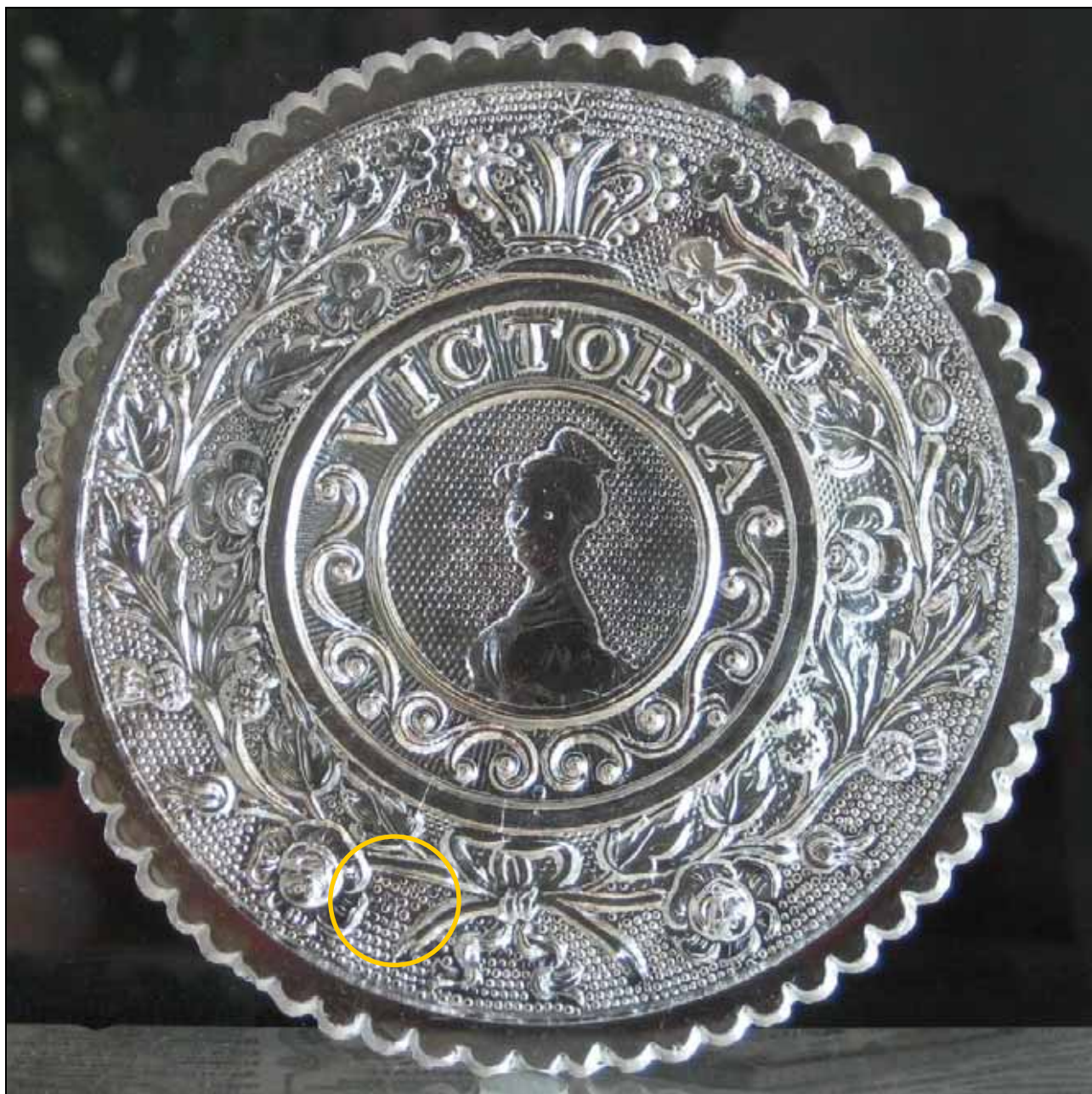
Abb. 2008-4/180, Maßstab ca. 166 %

Teller „VICTORIA“, halblinks blickend, mit Krone, Rosen-, Distel- und Kleezweige, Grund Sablée, Rand mit 65 gleichen Bögen Queen Victoria, Thronbesteigung 1837, Krönung 1838