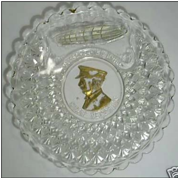
Abb. 2008-4/279 eBay DE, Art.Nr. 310088073877, € 22,50 "Pressglas Teller Graf Zeppelin, Goldfarbe Aufschrift „Deutschland's Ruhm“ und „Graf Zeppelin“ D 21,5 cm SG: Hersteller unbekannt, Deutschland 1908-1916

Eine ausführliche Darstellung der verschiedenen Luftschiffe und des Lebens von Graf Zeppelin siehe PK 2004-1.