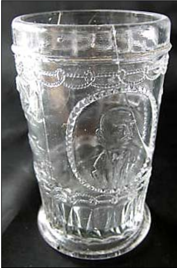
Abb. 2008-4/280 eBay DE, Art.Nr. 350102056156, € 25,00 "Pressglas Becher Graf Zeppelin mit Luftschiff, Aufschrift unter dem Fuß: „Muster geschützt“, entstanden um 1908 anlässlich des 70. Geburtstages des Erfinders“, H 9,8 cm, D 6 cm SG: Hersteller unbekannt, Deutschland 1908-1916 dieser Becher entspricht PK Abb. 2000-5/101 aus Auktionskatalog Dr. Fischer 2000-1, Kat. Nr. 115, Abbildung Tafel 41