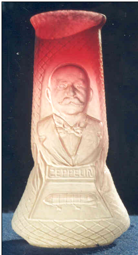
Abb. 2004-1/141 Andenken-Vase, Bildnis Ferdinand Graf von Zeppelin Aufschrift „ZEPPELIN“, Darstellung eines Luftschiffes farbloses Pressglas, H 15,6 cm Sammlung Stopfer vielleicht 1908 zum 70. Geburtstag des Grafen Zeppelin PK 2008-4, SG: Hersteller unbekannt, Deutschland 1908-1916

Eine genauere zeitliche Bestimmung kann nur der Vergleich des auf dem Teller abgebildeten Luftschiffes mit den markantesten Typen von 1900 bis 1937 bringen. Dabei ist wichtig, dass auf dem Teller deutlich zwei unten hängende offene Kabinen gezeigt werden. Zwischen den Kabinen sind keine langen Bauchflossen, sondern die Funkantenne des Luftschiffes. Das hat der Entwerfer