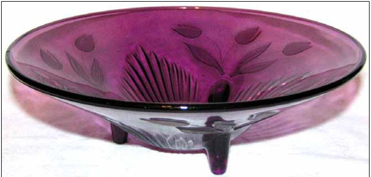
Abb. 2008-4/294 Schale mit 3 Füßen, Tulpen- und Pseudoschliff-Dekor, violetteres Pressglas, H 8,5 cm, D 25 cm Sammlung Rühl & Sadler s. MB VEB Glaswerk Schwepnitz, nach 1968, Tafel ohne Nummer, Service „Tulpen“, Nr. 28554