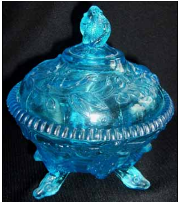
Abb. 2008-4/229 Deckeldose mit Fischen, Langusten und Wasserpflanzen blaues Pressglas, H 14 cm, D 14 cm Sammlung Groß vgl. Sammlung Fehr, PK Abb. 2003-4/074 vgl. eBay DE PK Abb. 2003-4/169 Hersteller unbekannt, Frankreich?, um 1920

Die Gestaltung der Wassertiere ist naturalistisch, so dass diese Gläser wahrscheinlich erst nach dem Ersten Weltkrieg entstanden sind, also ca. 1920.