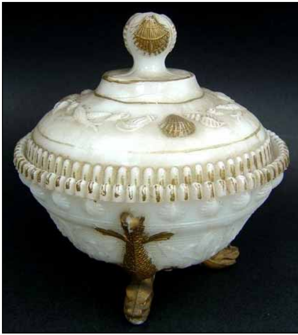
Abb. 2006-2-05/120 (Ausschnitt) MB Sars-Poteries 1885, Planche 86, Sucriers moulés, No. 1969, Sucrier dauphin Sammlung Neumann