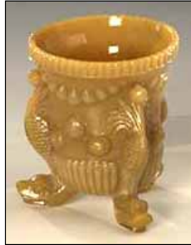
Abb. 2004-1/070 Vase mit drei Delphinen und Muschel-Dekor, 3 FüÙe opak-marmoriertes Pressglas, H 8,2 cm, D 6,2 cm Sammlung Vogt Hersteller unbekannt, England?, um 1890 oder Frankreich, 1880-er Jahre

Abb. 2003-4/247 Vase mit drei Delphinen und Muschel-Dekor, 3 FüÙe opak karamel-braunes Pressglas, H 8,5 cm www.auktionshaus-wendl.de , Art.Nr. 1834, Preis € 75,00