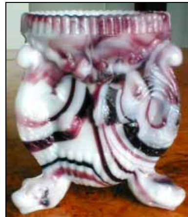
Abb. 2004-1/151 Vase mit drei Delphinen und Muschel-Dekor, 3 FüÙe opak-„purpur-malachit-marmoriertes“ Pressglas, H xxx cm http://1st.glassman.com/gallery-slag/slides/purplemalachitespillvase.html "Frankreich?, 1880-er Jahre"

Abb. 2004-1/070 Vase mit drei Delphinen und Muschel-Dekor, 3 FüÙe opak-marmoriertes Pressglas, H 8,2 cm, D 6,2 cm Sammlung Vogt Hersteller unbekannt, England?, um 1890 oder Frankreich, 1880-er Jahre