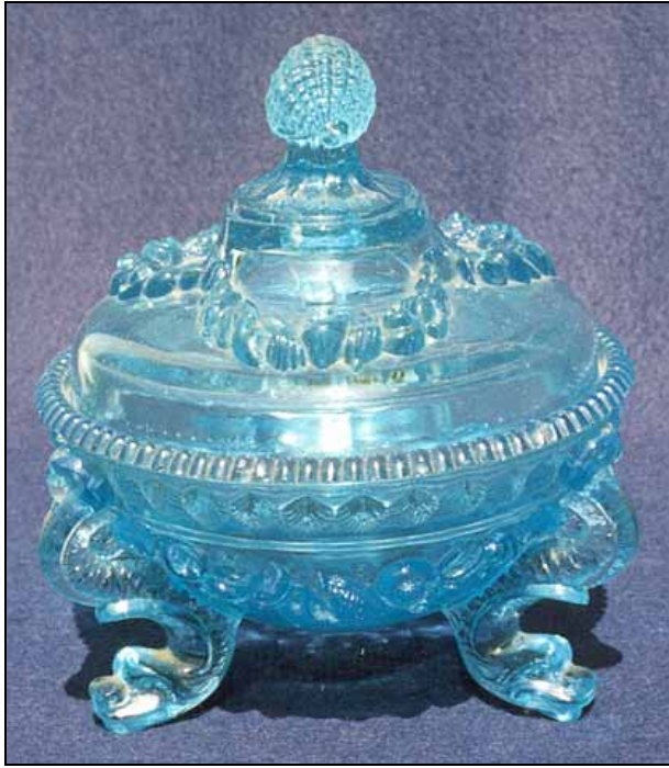
Abb. 2000-1/069 Vase mit Muscheln und Delphinen hell-blau transparentes Pressglas, H 8,5 cm Sammlung Stopfer (Hosch) vgl. MB Vallérysthal 1907, S. 237, 3. Zeile, 1. Glas, Deckeldose Nr. 3828 PK 2004-2, Christoph: MB Sars Poteries 1885, Planche 94, No. 2136, Moutardier

Abb. 2000-1/068 Deckeldose mit Muscheln und Delphinen hell-blau transparentes Pressglas, H ca. 15,5 cm Sammlung Stopfer (Hosch) s. MB Vallérysthal 1907, S. 237, 3. Zeile, 1. Glas, Deckeldose Nr. 3828 s. MB Vallérysthal 1894, 2. Partie, Planche 246, Beurriers non rebrulées, No. 3814 , PK Abb. 2005-1-08/017