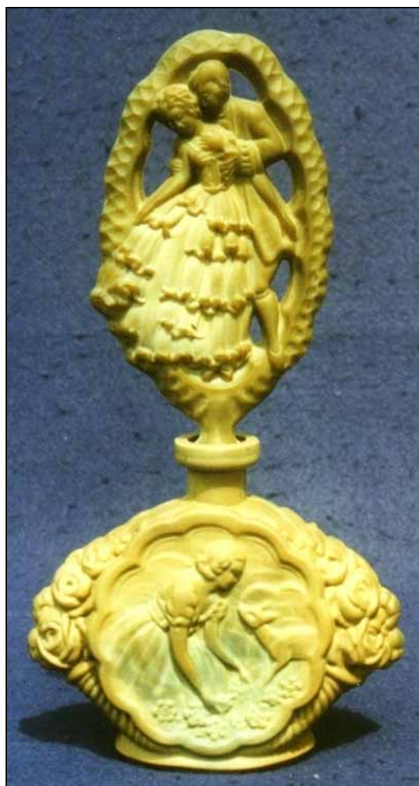
Abb. 2008-3/228 rechts Flakon Frau mit einem Reh opak-hellbraunes Pressglas, H insg. 22,8 cm Sammlung Stopfer Vogel & Zappe, Gablonz, 1930-er Jahre Prod.Nr. Flakon 263 / 11136, Stopfen Hersteller unbekannt s. Lněničková, Schránky Vůní 1999, S. 107