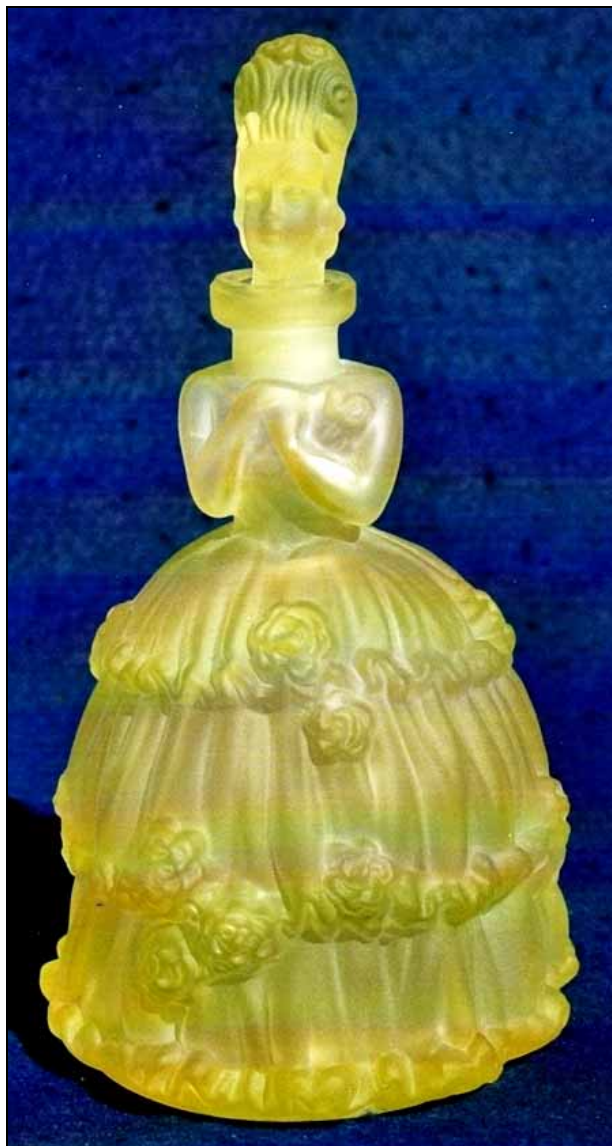
Abb. 2008-3/227 Likör-Karaffe Frau mit Krinoline uran-gelbes Pressglas, H 15,3 cm, D Boden 8,5 cm Sammlung Stopfer Vogel & Zappe, Gablonz, 1930-er Jahre Prod.Nr. 695/696, später Garnitur 35192

Abb. 2008-3/226 rechts (s.a. Abb. 2006-3/361 ...) Flakon mit Stopfen Frau in einer Fontaine farbloses Pressglas, H insg. 18,8 cm Sammlung Stopfer Vogel & Zappe, Gablonz, 1930-er Jahre s. Nový, Lisovane sklo ... 2002, S. 166