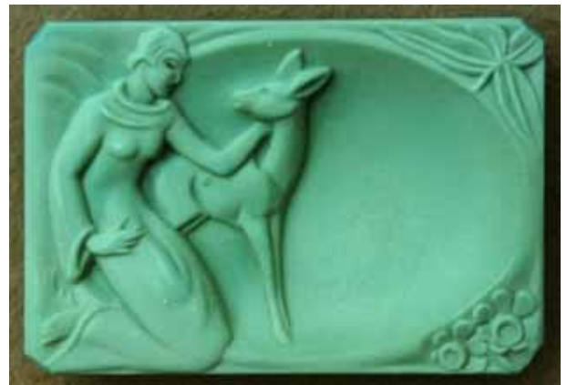
Abb. 2008-3/216 Schale Frau mit einem Reh opak-türkis-grünes Pressglas, H 1,8 cm, B 7 cm, L 10 cm Sammlung Stopfer Vogel & Zappe, Gablonz, 1930-er Jahre Prod.Nr. 535 s. Nový, Lisované sklo ... 2002, S. 166

Bisher können leider nur einige Objekte sicher zugeordnet werden. Viele Produkte der Firma Vogel & Zappe weisen eine große Ähnlichkeit mit den Erzeugnissen der Firmen Heinrich Hoffmann und Curt / Henry G. Schlevogt auf. Neben Kristallglas verwendeten Vogel & Zappe auch die Glasmassen „Jade“ sowie „Lapis“ und „Türkis“ für ihre Objekte. Im Archiv der „Jablonex Group“ sind viele Kopien mit geometrischem Schliffdesign der Firma Vogel & Zappe. Für uns sind aber in erster Linie die gepressten Dosen und Flakons von Interesse. Leider sind auch dort nicht alle Objekte zu finden.