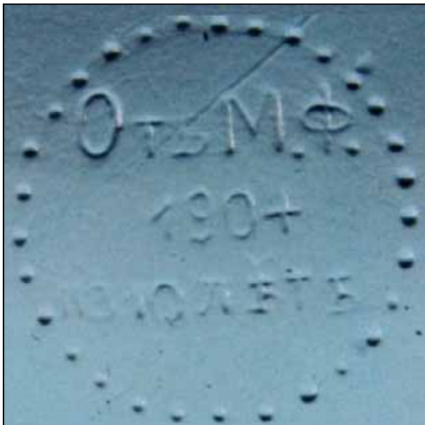
Abb. 2008-3/188 Zuckerkasten mit Rauten-Muster, blaues Pressglas, H 10 cm, B ??? cm, L ??? cm im Boden eingepresste Marke mit russisch-kyrillischer Inschrift und Jahreszahl „ОТЪМ.Ф. 1904 на10ЛЪТЬ“ s. MB Zabkowice um 1930, Tafel 38, Nr. 2241/IIx, hergestellt ab 1904 aus Dr. Fischer Heilbronn, Spezialauktion Russisches Kunsthandwerk & Gemälde, Mai 2008, Los Nr. 230

PK 2008-2, SG: Die russisch-kyrillische Pressmarke mit der Jahreszahl „1904“ hat beim bekannten Auktionshaus Dr. Fischer, Heilbronn, dazu geführt, dass ein blauer Pressglas-Zuckerkasten aus Zabkowice „ Russland, 1904 “ zugeschrieben wurde. Das hat offenbar seinen Aufrufpreis gleich auf € 800 hoch getrieben. Es ist