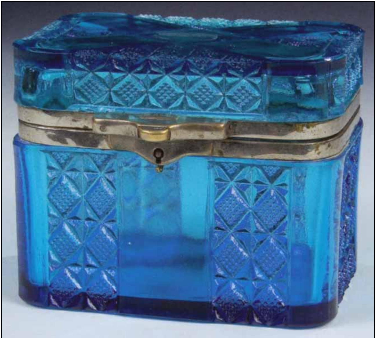
Abb. 2008-3/187 Zuckerkasten mit Rauten-Muster, blaues Pressglas, H 10 cm, B ??? cm, L ??? cm im Boden eingepresste Marke mit russisch-kyrillischer Inschrift und Jahreszahl „ ОТЪМ.Ф. 1904 на10льть “ s. MB Zabkowice um 1930, Tafel 38, Nr. 2241/IIx, hergestellt ab 1904 aus Dr. Fischer Heilbronn, Spezialauktion Russisches Kunsthandwerk & Gemälde, Mai 2008, Los Nr. 230