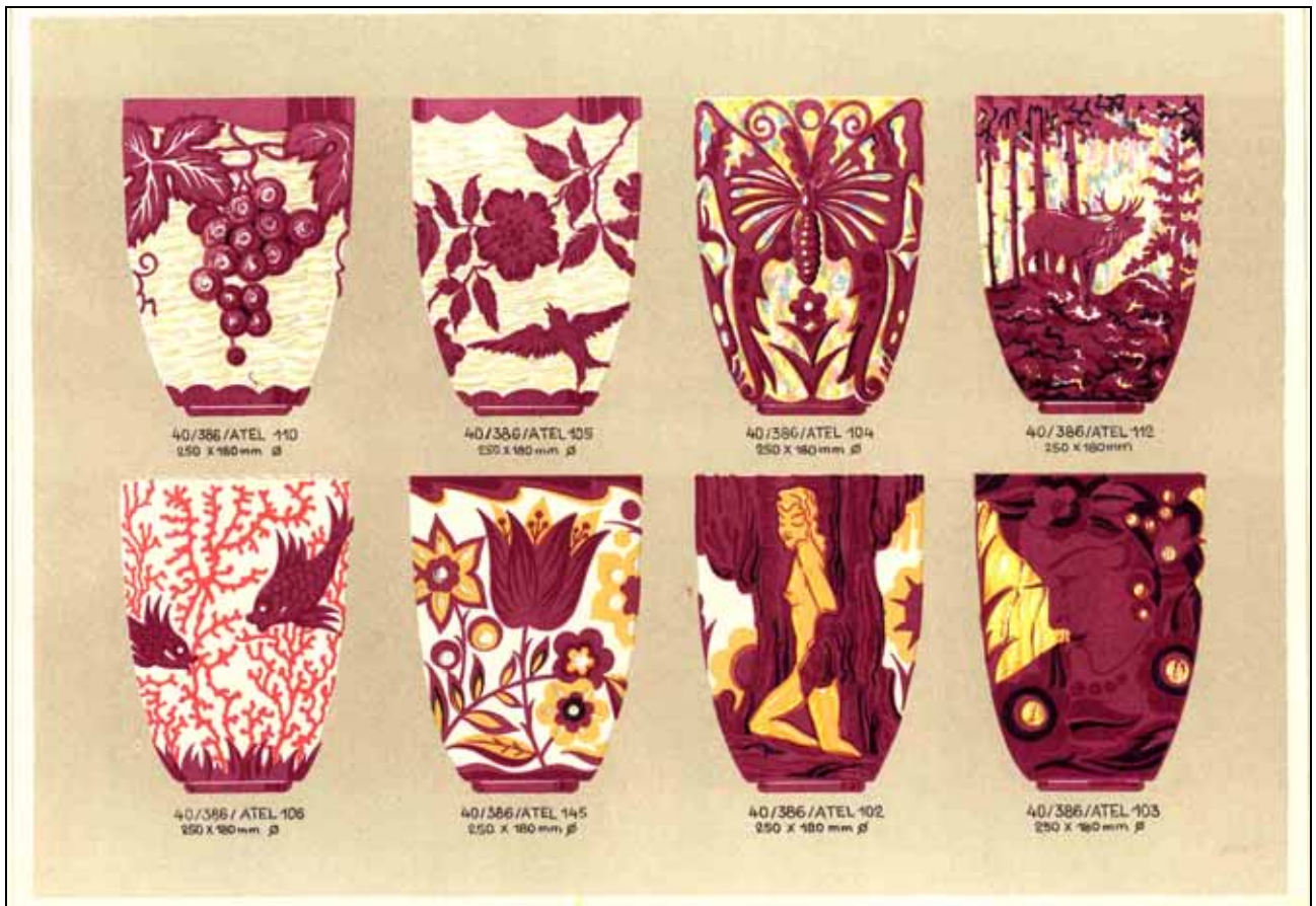
Abb. 2003-2/101 MB S. Reich & Co. ca. 1935, Vasen, Tafel o. Nr., Vasen ATEL Nr. 110, 105, 104, 112, 106, 145, 102, 103 Samml. Museum Valašské Meziříčí Inv.Nr. 92/03