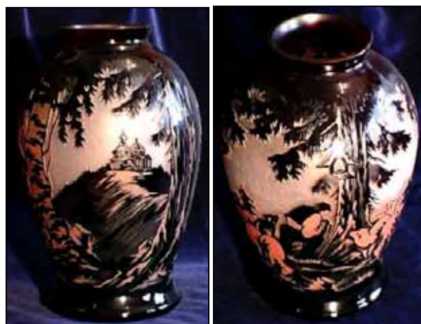
Abb. 2002-4/195 Vase der Glaswerke S. Reich & Co., um 1935 überfangen und geätzt, H 31 cm Motive aus den Wäldern auf dem Radhošt und an der R. Bečvá www.klimentantik.de/g1.html (2002-09) SG: vgl. MB S. Reich & Co. ca. 1935, Vasen, Tafel o. Nr., Va- sen ATEL, Nr. 112, 170 und 171

Das einstmals mächtige Glasunternehmen S. Reich & Co. hat es offenbar nicht geschafft, sich in den Köpfen der Glashistoriker einen festen Platz zu erobern. Auch hier werden wieder Fehler sogar im Internet weiter getragen, die später eine Suche mit GOOGLE oder YAHOO scheitern lassen! Das Glasunternehmen hieß nicht Solomon & Reich , sondern über 100 Jahre lang bis 1934 Salomon Reich & Co. Sein Hauptsitz war bis 1918 im k.k. Österreich-Böhmen / Mähren tatsächlich in Krasna an der Betschwa, ab 1918 bis 1934 aber in Krásno nad Bečvou, in der Tschechoslowakei. Quittenbaum hat wohl beim Glasmuseum Passau falsch abgeschrieben!