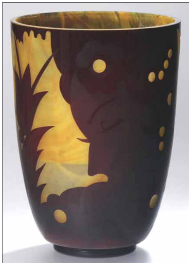
Abb. 2006-1/231 Becher-förmige Vase, als Dekor ein Frauenkopf sowie stilisierte Blatt- und Blütenornamente gelb marmoriertes Farbglas transparent und violett überfangen, geätzt und gekugelt H 25 cm, D unten 8,7 cm, D oben 17,8 cm am unteren Rand signiert mit eingravierter Schrift „R Krasno“ Sammlung Bröhan-Museum, Berlin (Inv. Nr. 92-049) s. MB S. Reich & Co. ca. 1935, Tafel o. Nr., Vase ATEL Nr. 103 MB Sammlung Museum Valašské Meziříčí Inv.Nr. 92/03

Abb. 2006-1/232 rechts Becher-förmige Vase, als Dekor ein Frauenkopf sowie stilisierte Blatt- und Blütenornamente geblasenes, farbloses Glas topas-gelb und rubinrot überfangen, zweimal geätzt H 25 cm „Böhmisch-Mährische Glasfabriken A.G., vorm. Solomon Reich & Comp., Krasna a. d. Betschwa, Mähren, nicht signiert Form und Dekor: um 1935“ formgleiche Vase mit sehr ähnlichem Dekor in Kunstge- werbemuseum Prag Sammlung Passauer Glasmuseum (Inv.Nr. Hö 56-966) Abb. aus Höttl, Das Böhmisches Glas 1700-1950, Band VI, S. 64, Nr. VI.67, Pa. s. MB S. Reich & Co. ca. 1935, Tafel o. Nr., Vase ATEL Nr. 103 MB Sammlung Museum Valašské Meziříčí Inv.Nr. 92/03 Dekor der Vase nicht völlig gleich mit der Vase Bröhan!