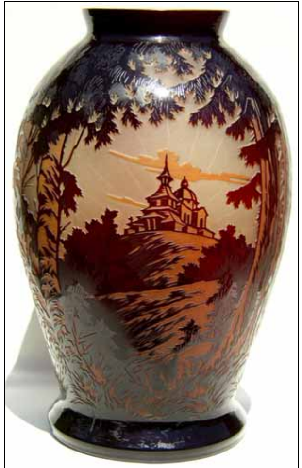
Abb. 2007-3/375 Vase mit Waldszenen farbloses, geblasenes Glas bernstein-gelb und dunkelrot überfangen, tiefgeätzt, mattiert H 29,6 cm, D Rand 9,9 cm, D Boden 14 cm Sammlung Geiselberger PG-1067 auf dem Boden geätzte Signatur „ČMS KRÁSNO“ Českomoravské sklárny - dříve [ehemals] S. Reich & Co., Krásno - Wien, 1935 vgl. MB S. Reich & Co. / ČMS, ca. 1935, Vasen, Tafel o. Nr., Vasen ATEL, Nr. 112, 170 und 171

In PK 2006-1 wurden zwei weitere Vase aus der Reihe neuer Entwürfe vor und um 1934 vorgestellt. Eine ist in der Sammlung Bröhan, Berlin - die andere ist im Glasmuseum Passau. Eine ähnliche gibt es im UPM Praha.