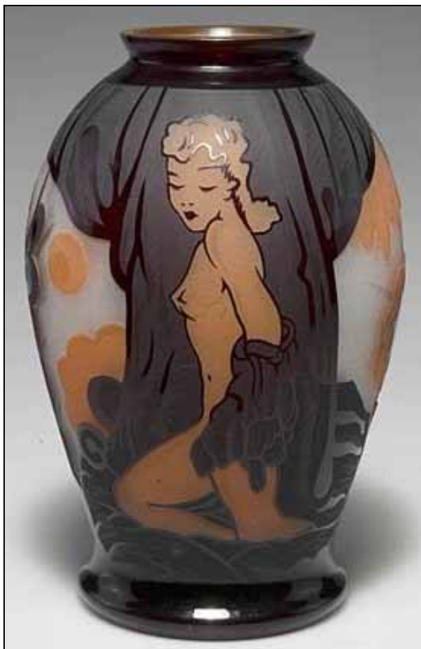
Abb. 2008-2/278 eBay USA, Art.Nr. 200217508002, € 1.200,00 Quittenbaum Auktion 072, 29.04.2008, Los Nr. 072409 „Solomon & Reich, Krasna, Vase, c. 1940 H 30 cm Overlaid glass, clear, orange and red, etched pattern, partially sand-blasted“ s.a. http://catalog.quittenbaum.de/object_detail_Vase_um_1940_Solomon_Reich_Krasna_42772_keyword... vgl. MB S. Reich & Co. / ČMS, ca. 1935, Vasen, Tafel o. Nr., Vase ATEL, Nr. 102

In PK 2006-1 wurden zwei weitere Vase aus der Reihe neuer Entwürfe vor und um 1934 vorgestellt. Eine ist in der Sammlung Bröhan, Berlin - die andere ist im Glasmuseum Passau. Eine ähnliche gibt es im UPM Praha.