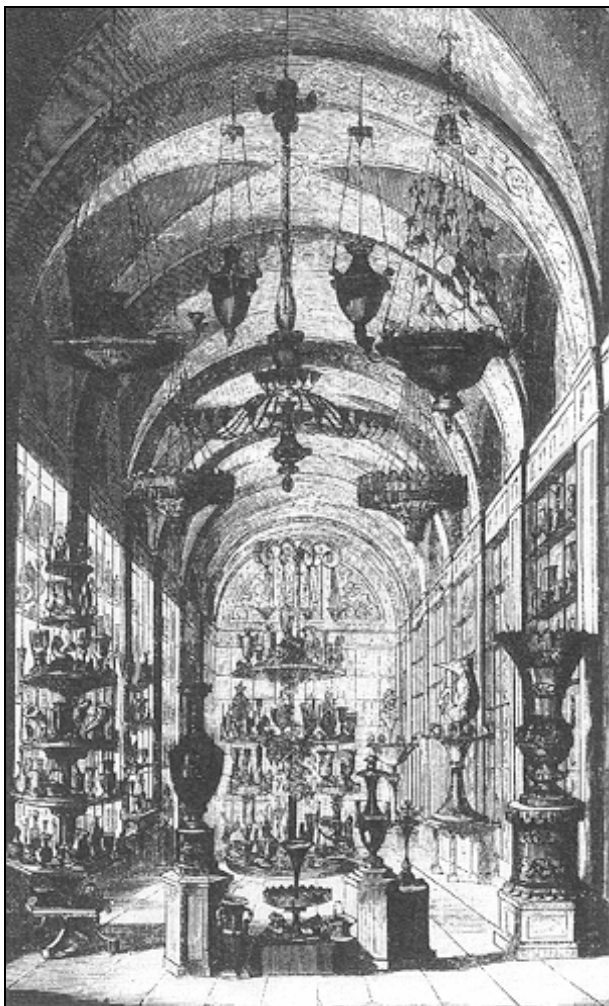
Abb. 2000-3/055 Glas-Bazar Steigerwald in München am Odeonsplatz, 1853 „Gläser aus Schachtenbach wurden präsentiert“ aus Sellner 1988, S. 46

Im Vergleich mit den bisher gefundenen Katalogen der Kristallglashütten von 1825 bis 1841 ist MB Theresienthal 1840 eine Sensation!