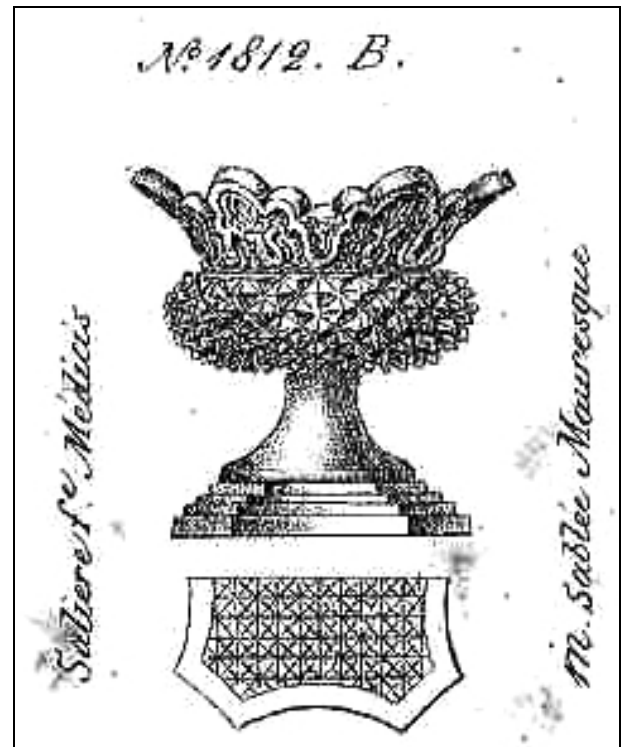
Abb. 2001-05/376 (Ausschnitt) MB Launay & Hautin, um 1840, Planche 50, Pièces diverses, Salières, Nr. 1812 B. [Baccarat] Salière f°. Médicis m. sablée Mauresque [= forme]

In PK 2002-5, S. 98, wurde eine böhmische oder mährische form-geblasene Fußschale mit vier verschiedenen Füßen abgebildet. Auch hier wurden die Fußteile willkürlich vertauscht. Auch Christiane Sellner weist 1986 in ihrem Ausstellungskatalog „Glas in der Vervielfältigung“ darauf hin, „dass die einzelnen Formelemente bisweilen vertauscht worden sind“.