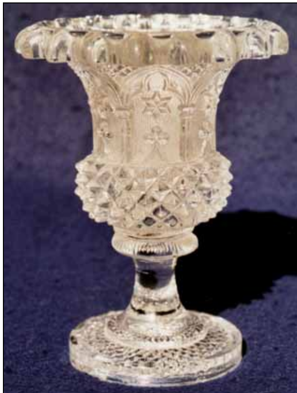
Abb. 2007-4/028 Vase mit Fuß, neo-gotisches Motiv, runder Fuß farbloses Pressglas, H 12,3 cm, D 9 cm Sammlung Stopfer S. MB Launay, Hautin & Cie. um 1840, Planche 26, No. 1399 B. [Baccarat] (4 ½), Vase Médicis m. sablée à arcades gothiques

Schon längere Zeit besitze ich eine kleine Vase von Baccarat mit rundem Fuß (MB Launay, Hautin & Cie. 1840, Planche 26, No. 1399).