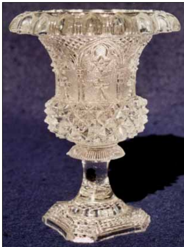
Abb. 2007-4/029 Vase mit Fuß, neo-gotisches Motiv, eckiger Fuß farbloses Pressglas, H 12,5 cm, D 9 cm Sammlung Stopfer S. MB Launay, Hautin & Cie. um 1840, Planche 26, No. 1399 B. [Baccarat] (4 ½), Vase Médicis m. sablée à arcades gothiques Fuß s. MB Launay, Hautin & Cie. um 1840, Planche 50, No. 1812 B. [Baccarat], Salière f°. Médicis m. sablée Mauresque

sind vollkommen ident, während die Füße verschieden sind. Im Musterbuch ist die Vase mit rundem Fuß abgebildet. Die neue Vase hat einen eckigen, treppenförmigen Fuß.