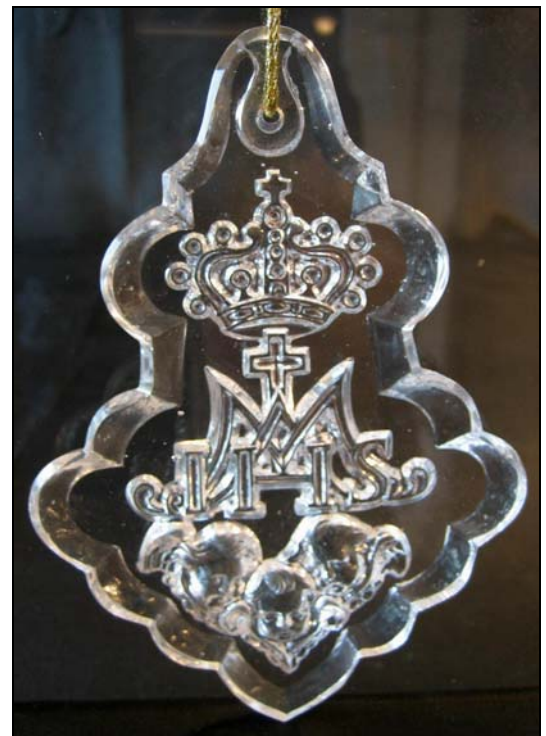
Abb. 2007-3/192 Lusterbehang / Pendeloque mit einer Drückerzange gedrucktes, farbloses Glas, H 12,5 cm Flächen und Ränder nachgeschliffen s. MB Josef Riedel, Polaun, um 1885, Tafel 14, Nr. 287