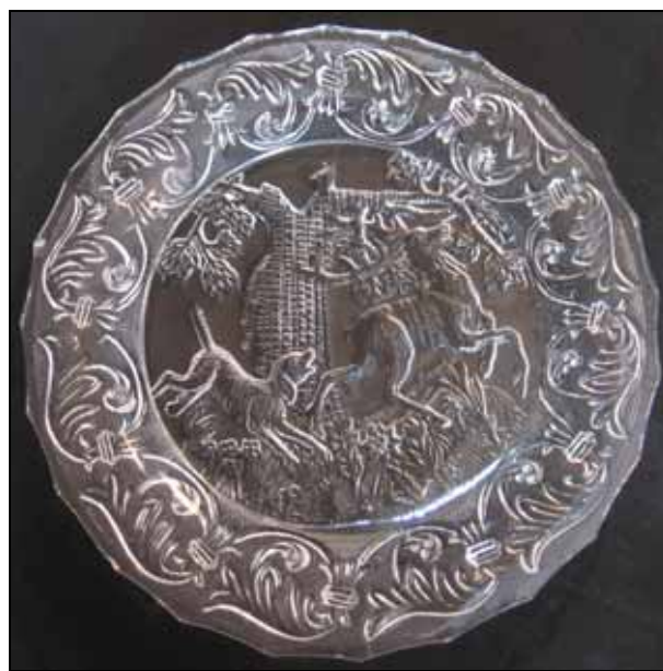
Abb. 2004-1/075 Teller mit Jagdszene - Hirsch und Hund vor einem Baum Rand mit 7 x 2 Blumenbuketts im Wechsel farbloses Pressglas, H 2,5 cm, D 22,3 cm Sammlung Vogt Hersteller unbekannt, vielleicht Reijmyre, 1850-er Jahre

Abb. 2007-2/068 Teller mit Jagdszene - Hirsch und Hund vor einem Baum Rand mit Girlanden, farbloses Pressglas, D 16,5 cm, G 325 g Sammlung Vogt Hersteller unbekannt, vielleicht Reijmyre, 1850-er Jahre