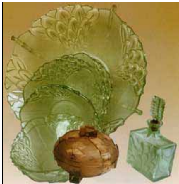
Abb. 2007-2/126 form-gebasene und gepresste Gläser Huty szklane J. Stolle, Niemen, 1930-er Jahre aus http://artandbusiness.onet.pl/1088692,artykul.html