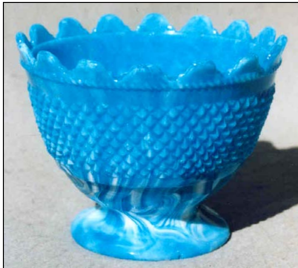
Abb. 2006-3/250 Unterteil einer Deckeldose opak-blau-weiß marmoriertes Pressglas, H 9,5 cm, D 12 cm Band aus kleinen Diamanten, Rand aus gekerbten Bögen und Schnur Sammlung Stopfer ohne Marke Hersteller unbekannt, Böhmen, um 1900 vgl. MB Reich 1873, Tafel 44, Muster „Steindelband“, Nr. 1758 vgl. MB Ehrenfeld 1886, Tafel 58, Muster „Ida“, Nr. 1242 ...