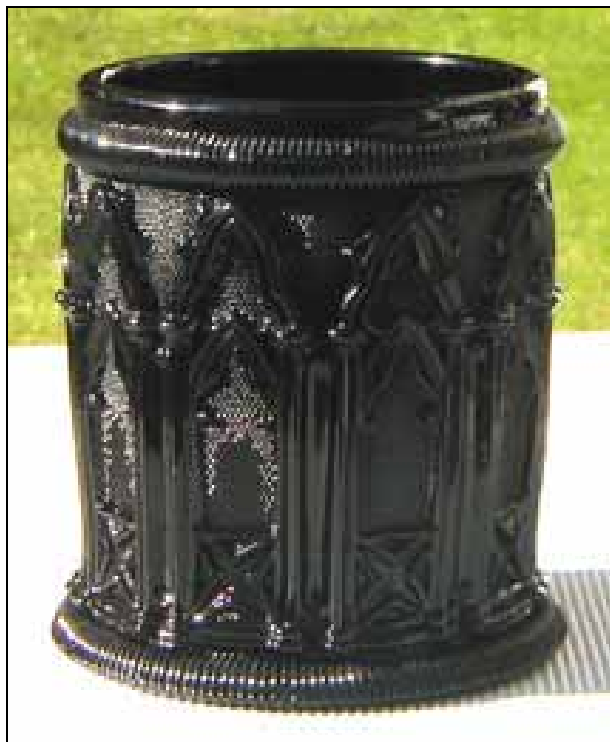
Abb. 1999-5/154 "Vase médicis à anse m. sablée" opak-schwarzes Pressglas, H 18 cm "St. Louis oder Baccarat, Etikett „Frankreich 1837“ aus Neuwirth 1993, S. 148, Abb. 115, Techn. Museum Wien s. MB Launay, H. & Cie. 1840, Planche 26, Nr. 1400, St. Louis