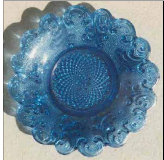
Abb. 2006-2/012 Teller mit Rocailles, Sablée kobalt-blaues Pressglas, D 11,6 cm uran-grünes Pressglas, D 11,6 cm Sammlung Stopfer s. MB Launay, Hautin & Cie. um 1840, Planche 49, No. 1785, Baccarat, Tasse à déjeuner Jouet m. sablée rocaille, U.tasse

herstellte - nach dem Krieg des Deutschen Reichs und der deutschen Besetzung und Annektion von Elsaß-Lothringen 1870/1871, Vallérysthal und St. Louis lagen nun im deutsch besetzten Teil Frankreichs, Vallérysthal war mit Portieux vereinigt. Über die Farben der Pressgläser von Vallérysthal um 1873 weiß man bisher nichts.