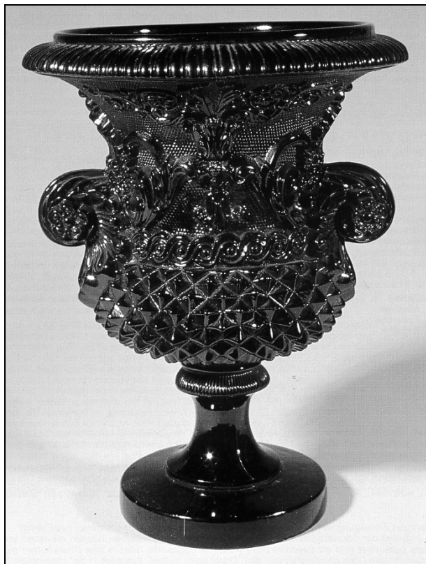
Abb. 1999-5/154 "Vase médicis à anse m. sablée" opak-schwarzes Pressglas, H 18 cm "St. Louis oder Baccarat, Etikett „Frankreich 1837“ aus Neuwirth 1993, S. 148, Abb. 115, Techn. Museum Wien s. MB Launay, H. & Cie. 1840, Planche 26, Nr. 1400, St. Louis