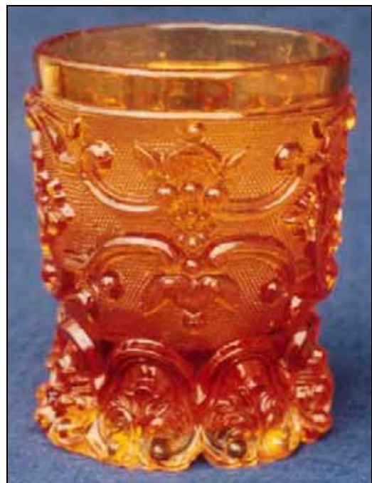
Abb. 1998-2/007 und Abb. 1999-1/ohne Nummer Fußbecher mit Bögen, Ranken und Muscheln, Sablée bernstein-farbenes Pressglas, H 14,9 cm, D 8,8 cm Fischer Auktion Zwiesel 1998, Abb. 416 farbloses Pressglas, H 14,9 cm, D 8,8 cm Sammlung Geiselberger PG-001 s. MB Launay, Hautin & Cie. um 1840, Planche 65, No. 2104 u. 2105, Baccarat, Verre Ballon / gondole m. sablée, Écussons