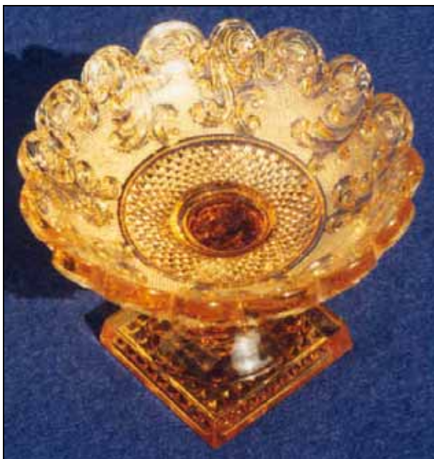
Abb. 2006-2/020 Fußschale mit Rocaillen, Sablée bernstein-farbenes Pressglas, H 8,2 cm, D 10,4 cm Sammlung Stopfer s. MB Launay, Hautin & Cie. um 1840, Planche 49, No. 1776, Baccarat, Baguier forme coupe m. sablée rocaille