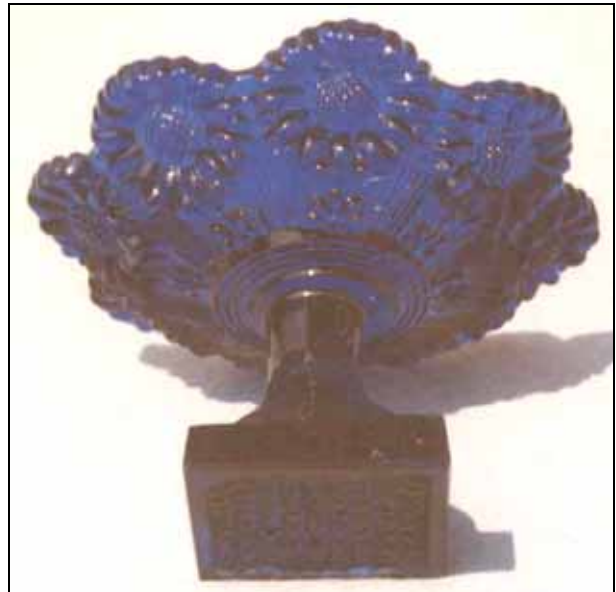
Abb. 2006-2/022 Salzfaß mit Blüten, Sablée bernstein-farbenes Pressglas, H 4 cm, D 7,5 cm Sammlung Stopfer s. MB Launay, Hautin & Cie. um 1840, Planche 62, No. 2056, Baccarat, Salière étroite du fonde m. sablée fleurons