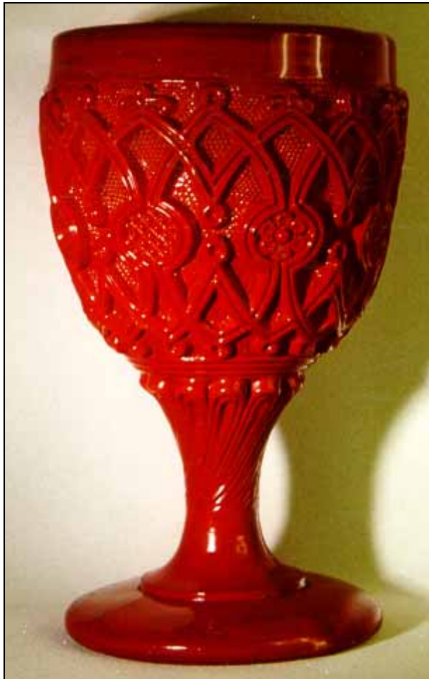
Abb. 1999-1/ohne Nummer Fußbecher mit kreuzenden Bögen, Sablée opak-siegellack-rotes Pressglas, H 14,5 cm, D 8,5 cm Sammlung Geiselberger PG-001 s. MB Launay, Hautin & Cie. um 1840, Planche 52, No. 1850 u. 1851, St. Louis, Verre gondole m. sablée à arceaux et rosace