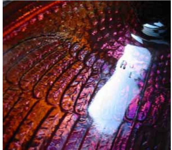
Abb. 2005-4/143 Schwan als Deckeldose amethyst-farbenes, irisierendes Pressglas H 13 cm, B 14 cm, L 19,5 cm Sammlung Peltonen Reg.Marke „Rd xxx“, Sowerby, Gateshead- on-Tyne registriert 1885, als Carnival Glass wahrscheinlich erst nach 1920 hergestellt

Der Schwan von Sowerby 1885 in "rare amethyst", Favorit von Glen & Steve Thistlewood, s. http://www.glass.co.nz/Engcarnival.html . Hergestellt in Carnival Glass wahrscheinlich erst nach 1920. Interessant ist, und das wurde auch in einigen Büchern besonders genannt, dass die Registernummer nicht vorhanden ist. Nur „Rd“ und die Nummer „1“ ist zu sehen. Das Pressen ist perfekt, es ist also kein Pressfehler. Vielleicht hat man bei Sowerby, als man die alte Pressform wieder verwendet hat, die ursprüngliche Registernummer aus dem Stempel teilweise entfernt?