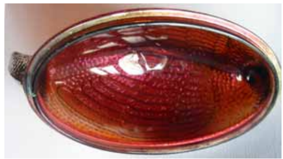
Abb. 2005-4/144 Schwan als Deckeldose, amethyst-farbenes, irisierendes Pressglas, H 13 cm, B 14 cm, L 19,5 cm, Sammlung Peltonen Reg.Marke „Rd xxx“, Sowerby, Gateshead- on-Tyne, registriert 1885, als Carnival Glass wahrscheinlich erst nach 1920 hergestellt s. Thistlewood, Sowerbys Illustrated Pattern Book No. XV, Sept 1895, Page 34, No. 1852 „Swan“