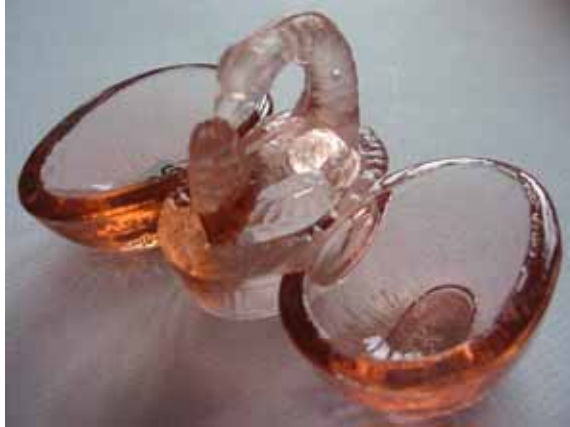
Abb. 2005-4/147 Schwan auf einem doppelten Salzfass rosa Pressglas, H 5,4 cm, B 6,2 cm, L 10,6 cm Sammlung Peltonen Hersteller unbekannt, Belgien oder Frankreich, um 1900

Ein Schwan auf einem doppelten Salzfass. Hersteller unbekannt, wahrscheinlich Belgien oder Frankreich.