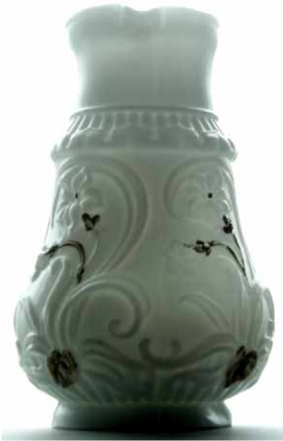
Abb. 2005-3/161 Kanne mit Blumen-Muster opak-weißes Pressglas, goldene Kaltbemalung (Reste) H 22,5 cm, D Mündung 8,5 cm, D Boden zwischen 9 und 11 cm (der Boden ist nicht kreisrund) Sammlung Schaudig Hersteller unbekannt, Frankreich, um 1900