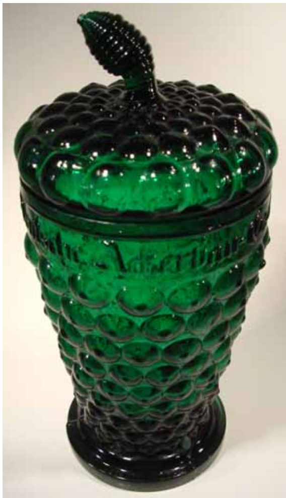
Abb. 2005-3/150 Deckelbecher als Weintraube, am Rand Inschrift "Deutsche Ackerbau- Gesellschaft. Dresden 1865" dunkel-grünes, form-geblasenes Glas, Form 3-teilig H 16,5 cm, H m. Deckel 19,5 cm, D 9 cm Sammlung Neumann Hersteller unbekannt, Radeberg?, Ottendorf-Okrilla? 1865

Abb. 2005-3/149 Deckelbecher als Weintraube, am Rand Inschrift "Deutsche Ackerbau- Gesellschaft. Dresden 1865" dunkel-grünes, form-geblasenes Glas, Form 3-teilig H 16,5 cm, H m. Deckel 19,5 cm, D 9 cm Sammlung Neumann Hersteller unbekannt, Radeberg?, Ottendorf-Okrilla? 1865