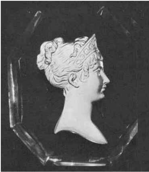
Abb. 2005-2/236 Achteckige Plakette Kaiserin Marie Louise Desprez Sammlung Jokelson aus Jokelson 1968, S. 47, Fig. 37