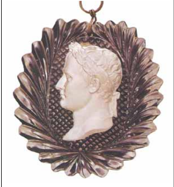
Abb. 2005-2/238 Ovale Plakette Kaiser Napoléon I. Baccarat vgl. Abb. 2005-2/256, Ovale Plakette Desirée aus Jokelson 1988, S. 59