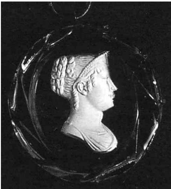
Abb. 2005-2/237 Runde Plakette Kaiserin Marie Louise die Bilder sind nicht gleich! D 5,4 cm aus Boisgirard 2000-11, S. 3 f., Nr. 3