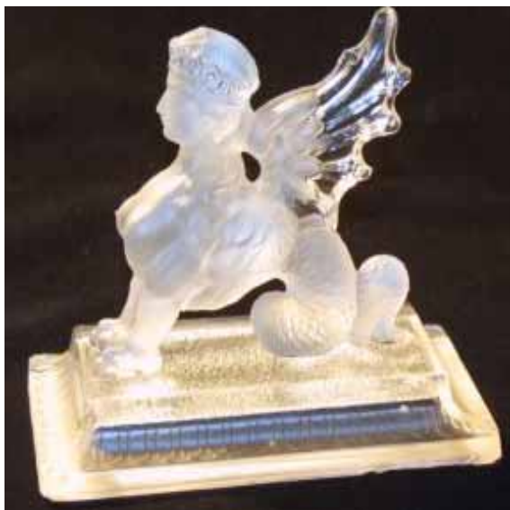
Abb. 2004-3/162 Catalogue Cristallerie Val Saint Lambert 1913, Tafel 48 ... Encriers, Nr. 4 „Chimère dépoli“, Cristal Maße der Basis des Schreibzeugs L 31 cm, B 15,5 cm Reprint Editions Collections Livres, Brüssel 1998