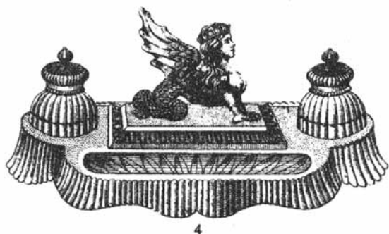
Abb. 2004-3/162 Catalogue Cristallerie Val Saint Lambert 1913, Tafel 48 ... Encriers, Nr. 4 „Chimère dépoli“, Cristal Maße der Basis des Schreibzeugs L 31 cm, B 15,5 cm Reprint Editions Collections Livres, Brüssel 1998