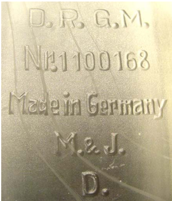
Abb. 2004-1/219 Limousine (ohne Räder) farbloses Pressglas, mattiert, H 4,8 cm, L 22 cm, B 7 cm Sammlung Neumann gemarkt auf dem Boden m. „SG in der Krone“ u. Schriftzug „D.R.G.M. / Nr.1100168 / Made in Germany / M.&J.D.“ Hersteller Malky & Jahncke, Deuben, um 1930?