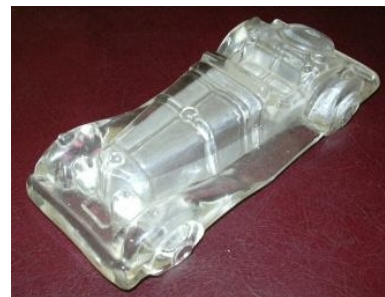
Abb. 2004-1/222 eBay Deutschland, Art.Nr. 2224034166, € 3,00 (kein Gebot) „Bleikristall-Automodell glatter Schliff größe 16 cm“ SG: Hersteller unbekannt